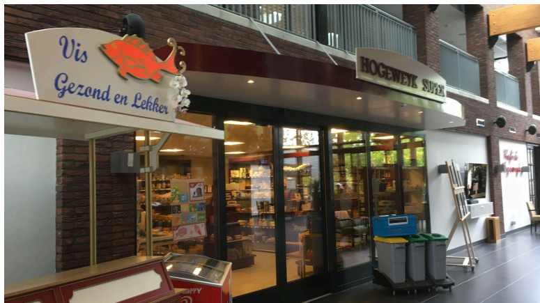
Hogeweykはアムスから高速列車ですぐのところの認知症の「村」(施設)